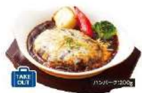
デミチーズハンバーグ 単品 980 円 (税込 1,078 円)