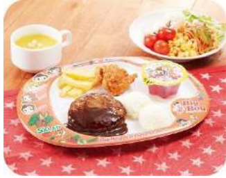
キッズ手ごねハンバーグ 680 円 (税込 748 円)