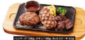
トリブルグリル 単品 1,180 円 (税込 1,298 円)