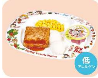
おこさまハンバーグ 680 円 (税込 748 円)

※小学生以下のお子様限定となります。 ※サラダバー・スープバー・ カレー・ライス・ドリンクバー付き ※ビッグボーイ ダイニング早稲田店では 商品内容・価格が異なります。