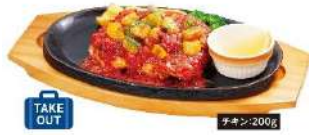
直火焼彩り野菜のトマトチキン 単品 880 円 (税込 968 円)