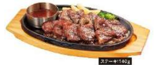
熟成カットステーキ 単品 1,180 円 (税込 1,298 円)

※ステーキビッグボーイ、ステーキヴィクトリア、ビッグボーイ ダイニング早稲田店では一部商品が異なります。